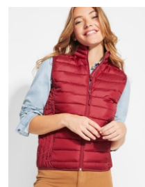
OSLO WOMAN RA5093