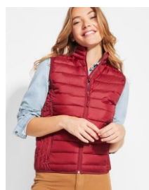
OSLO WOMAN RA5093