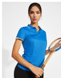
TAMIL WOMAN PO0409