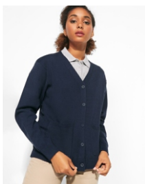
EXPLORER WOMAN CG8406