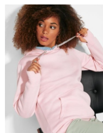
URBAN WOMAN SU1068